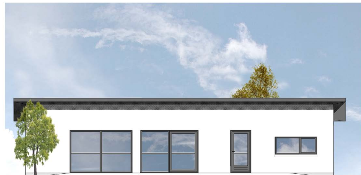
Facade mod syd / terrasse