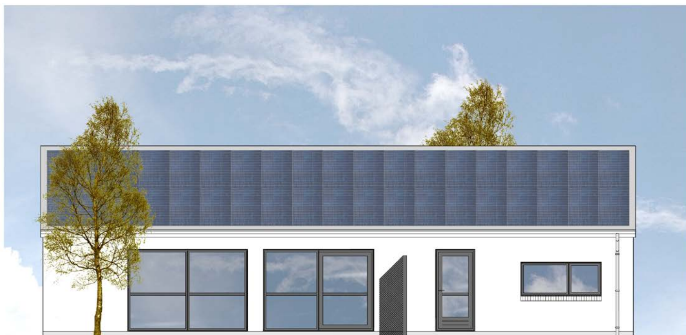
Facade mod syd