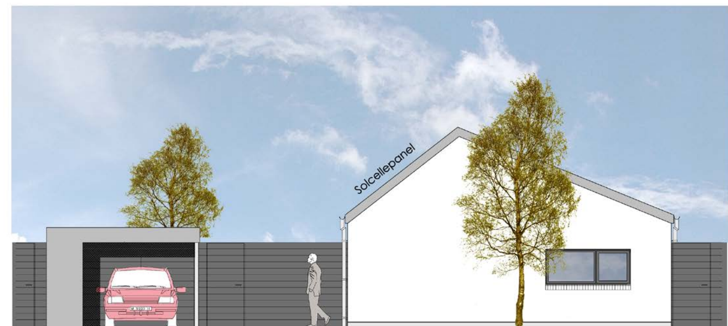
Gavlfacade mod vej