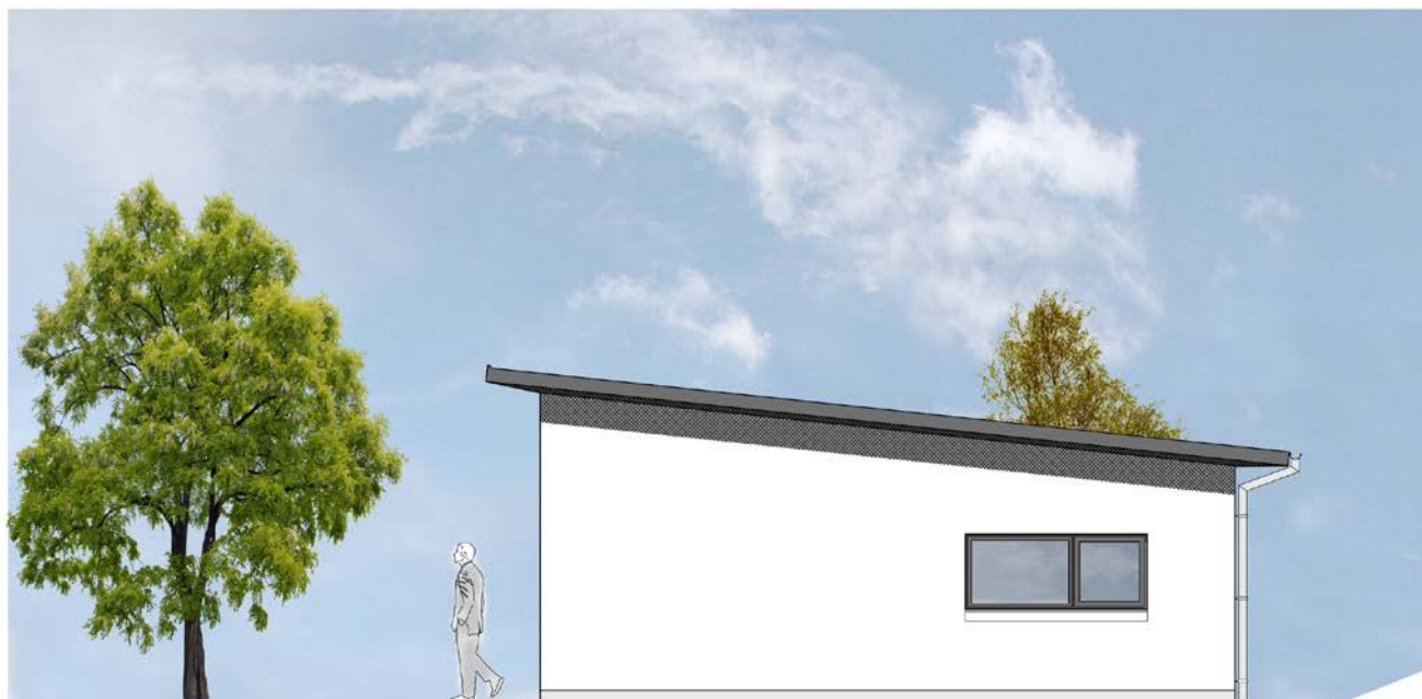
Facade mod øst / vej